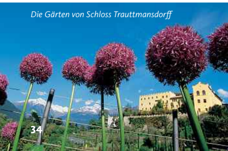
Die Gärten von Schloss Trauttmansdorff

1. April bis 15. November 09.00 – 19.00 Uhr 01. bis 15. November: 09.00 bis 17.00 Uhr Freitags von Juni bis August 09.00 bis 23.00 Uhr. Kein Ruhetag; Tiere nicht gestattet. Gruppenführungen nur auf Voranmeldung. Eintritt kostenpflichtig.